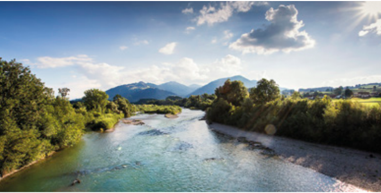
Iller bei Seifen

Geschichte einer der ältesten Städte Deutschlands geben die Multivisionsshow in der unterirdischen Erasmuskapelle am St. Mang-Platz, die Prunkräume in der Residenz oder der Archäologische Park Cambodunum. Über Immenstadt mit seinen historischen Bauwerken geht es nach Sonthofen, welches ein breit gefächertes Angebot an Sport- und Freizeitaktivitäten bietet. Auf dem Weg nach Oberstdorf passieren Sie den Illersprung. Sie starten oder beenden Ihre Tour in Oberstdorf mit seinem beeindruckenden Alpenpanorama. Das Naturschauspiel der Breitachklamm sowie mehrere Museen und natürlich die Arena der Skispringer sind nur ein paar der vielen Sehenswürdigkeiten, die einen Besuch wert sind.