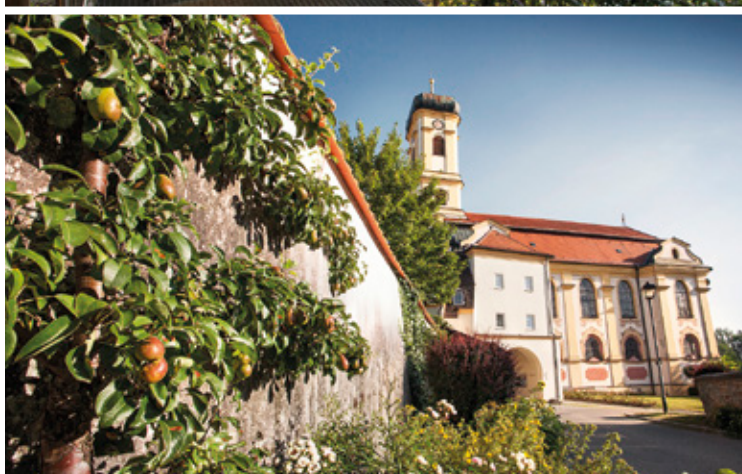
Maria Steinbach – einer der bedeutendsten Wallfahrtsorte im deutschsprachigen Süden.