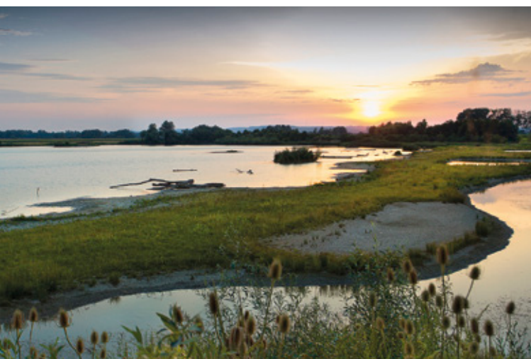
Seen und Fließgewässer an der Iller und im Urstromtal der Iller haben sich zu wichtigen Rast- und Brutplätzen für bedrohte Vogelarten entwickelt. So zum Beispiel das Schutzgebiet Plessenteich im Neu-Ulmer Stadtteil Gerlenhofen (o. l.) oder der Stausee bei Schnall (o. r.). Wer früh auf den Beinen ist, kommt in den Genuss, zahlreiche, teils seltene Vogelarten mit dem Fernglas beobachten zu können.

Radeln Sie auf dem Iller-Radweg weiter, kommen Sie nach Kirchdorf im mittleren Illertal. Sehenswert ist die alte Pfarrkirche St. Blasius. Nach Kirchdorf wartet Memmingen, die Stadt der Tore und Türme, darauf von Ihnen entdeckt zu werden. Doch überzeugen Sie sich selbst und entdecken Sie den einzigartigen historischen Charme der ehemals freien Reichsstadt.