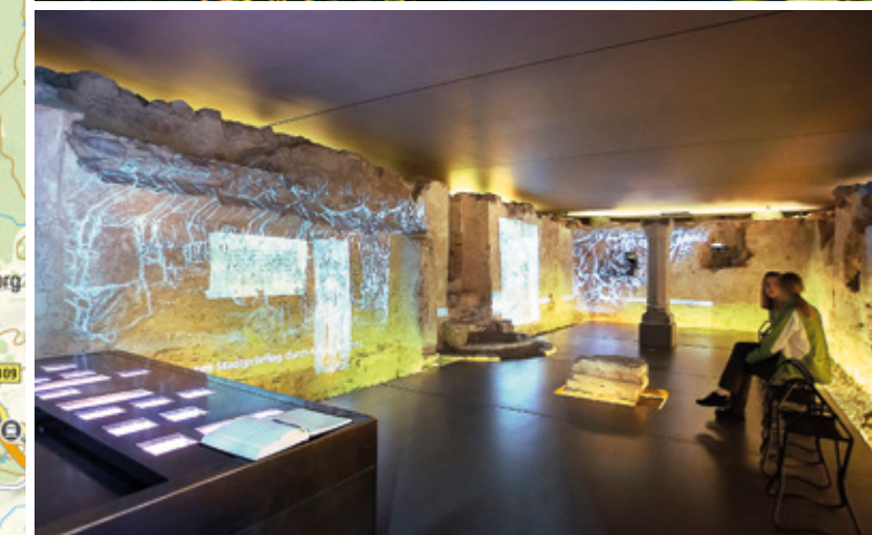
Unterirdische Erasmuskapelle am St. Mang-Platz in Kempten