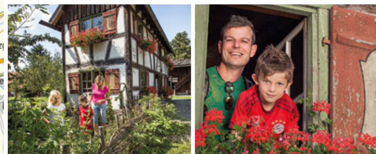
Schwäbisches Bauernhofmuseum Illerbeuren Mit vielen liebevollen Arrangements ermöglicht das Museum einen Blick hinter die Kulissen des bäuerlichen Lebens vergangener Jahrhunderte. Eine anschließende Erfrischung mit Spezialitäten aus dem Allgäu und Schwaben im Museumsgasthof Gromerhof gibt Power für die nächsten Kilometer.