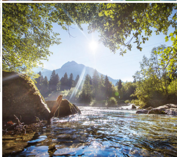
Illersprung mit imposanten Bergformationen. Die drei Gebirgsbäche Tretlach, Ställach und Breitach bilden die Iller.

Der Iller-Radweg ist durchgehend in beiden Richtungen beschildert. Das Signet mit dem Ulmer Spatz und den Alpen im Hintergrund begleitet Sie auf Ihrer Radtour auf dem Iller-Radweg.