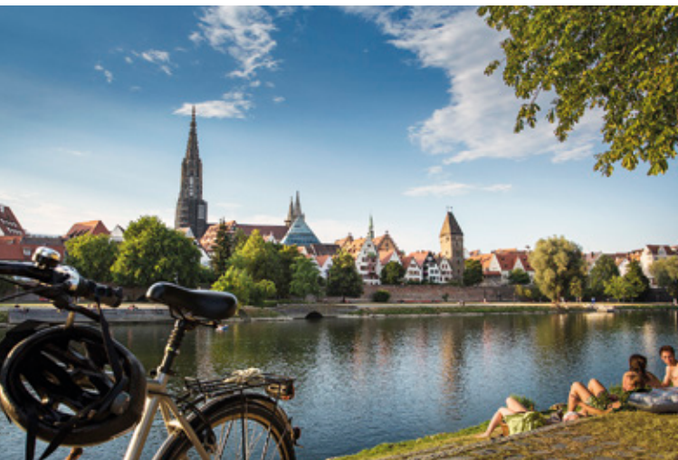
Die Uferböschungen der Donau in Neu-Ulm sind beliebte Rastplätze für Radler und Ausflügler, hat man doch einen fantastischen Blick auf die Ulmer Altstadt.

In Ulm begrüßt Sie der Ulmer Spatz. Am Start- oder Zielpunkt Ihrer Radtour in Ulm können Sie neben dem Ulmer Münster – mit dem höchsten Kirchturm der Welt – die zauberhafte Ulmer Altstadt mit dem malerischen Fischerviertel, das Kloster Wiblingen mit der sehenswerten Barockbibliothek (direkt am Iller-Radweg gelegen), die vielfältige Museumslandschaft Ulm/Neu-Ulm sowie die großzügigen Grünanlagen besuchen.