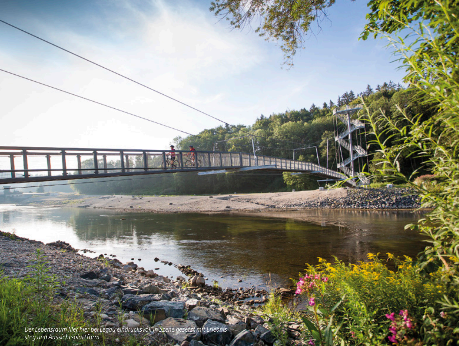
Der Lebensraum Iller hier bei Legau eindrucksvoll in Szene gesetzt mit Erlebnissteig und Aussichtsplattform.

Weiter auf dem Iller-Radweg geht es nach Illerbeuren. Dort lädt das Schwäbische Bauernhofmuseum Sie zu einem Rundgang durch die schwäbische Geschichte ein. Über 30 Gebäude aus vier Jahrhunderten geben Einblick in den bäuerlichen Alltag früherer Generationen. Wenn Sie weiter den Alpen entgegenradeln, kommen Sie nach Bad Grönenbach. Hier befinden Sie sich in einem der jüngsten Kneippheilbäder.